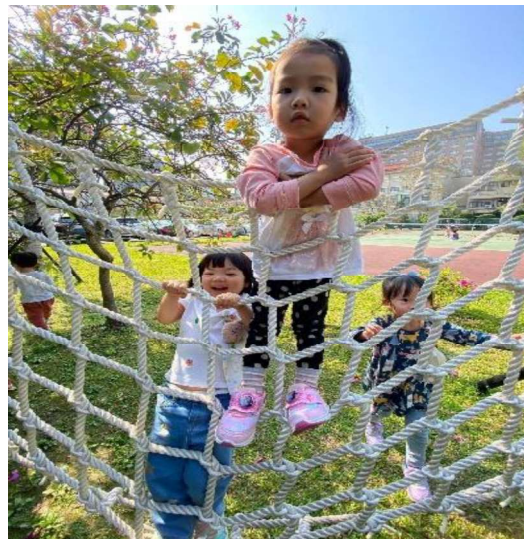
大肌肉活動:體能訓練~~攀繩索