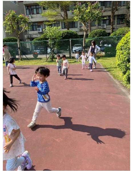
大肌肉活動:跑~跳~追