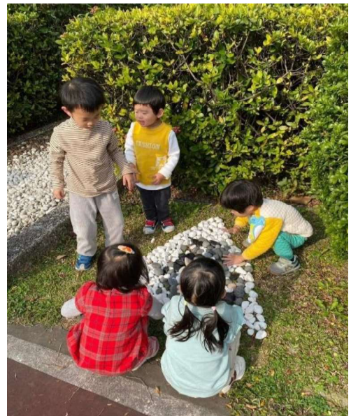
鬆散素材:石頭探索與合作學習~美感