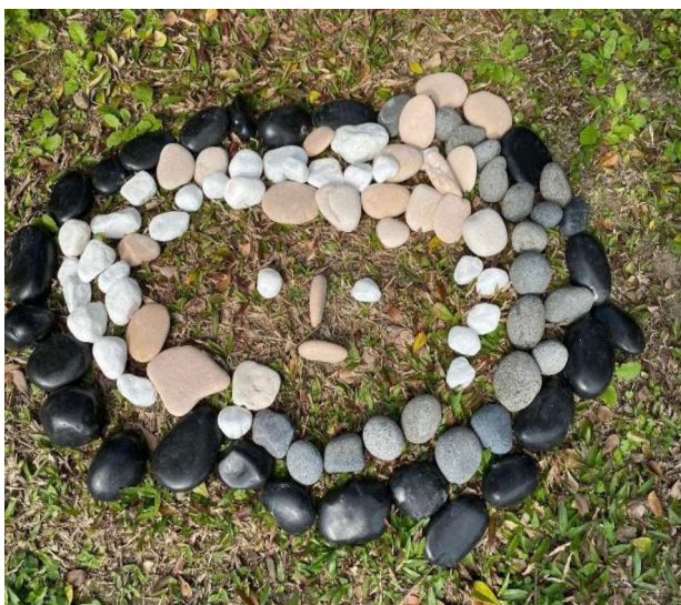
美感:訓練圖說能力~~藝術創作語言