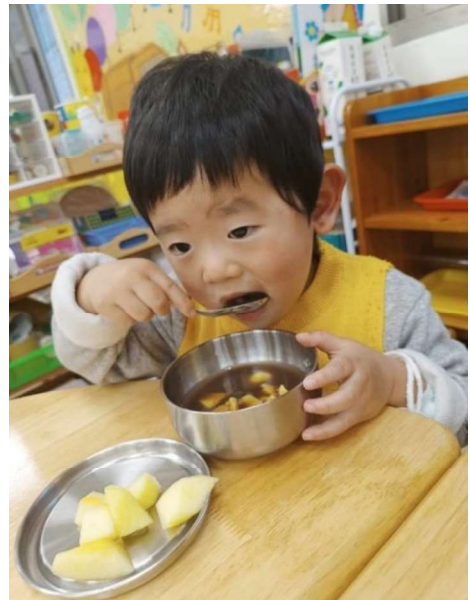
美食:營養點心~~紅豆湯元宵