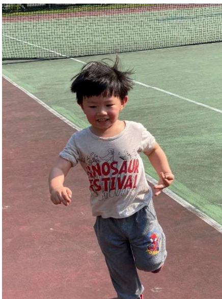
體能活動:感統訓練~~賽跑