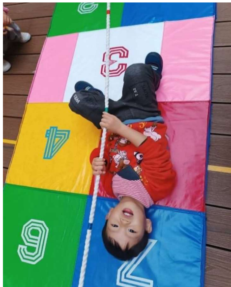
感統訓練:前庭發展