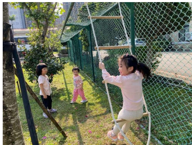
我們的遊戲:勇於探索~~盪鞦韆