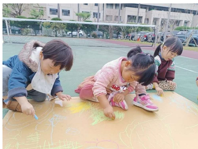
大地彩繪:合作學習~~創藝畫