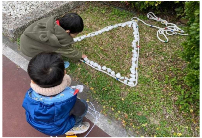
鬆散素材:石頭排列點、線、面構成圖