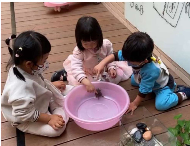
生命教育:愛護動植物與照顧~~飼養烏龜