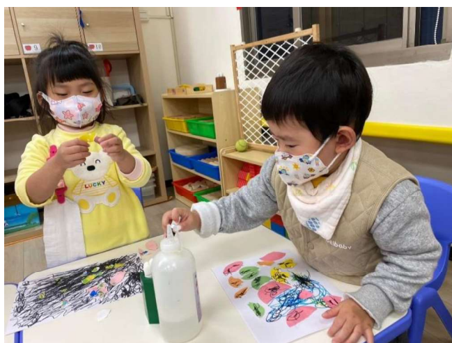
藝術創作:美感~~塗鴉撕貼創作畫