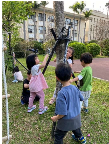
兒童藝術家:樹的彩繪