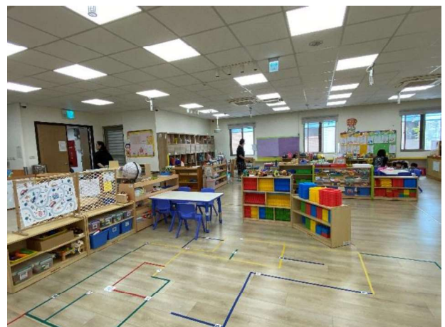
有機學習環境:學習區介紹~六大領域