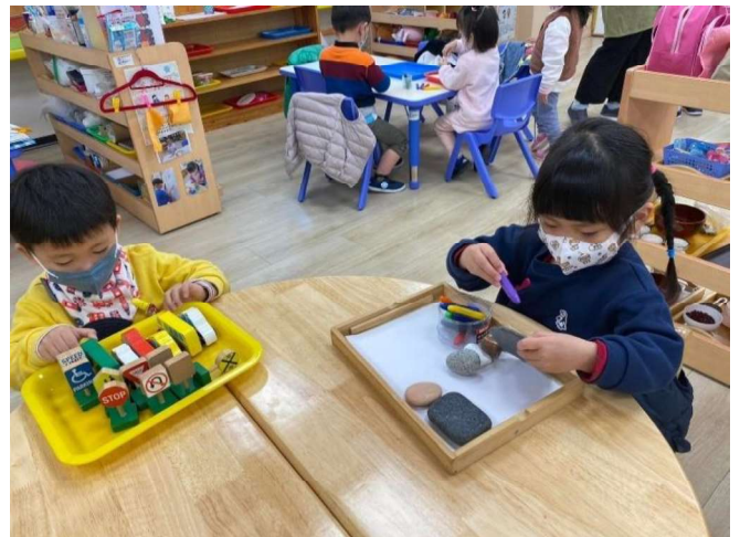
主題與學習區探索:數學、藝術