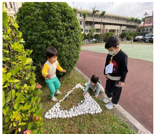
遊戲學習:快樂、合作與主動自主學習