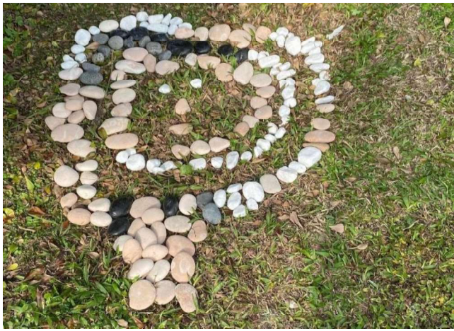
鬆散素材:專注力精細動作~石頭創作