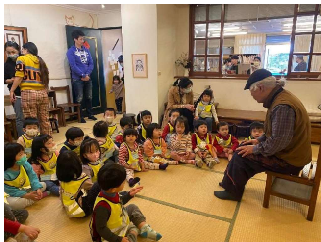
兒童哲學:楊爺爺說故事