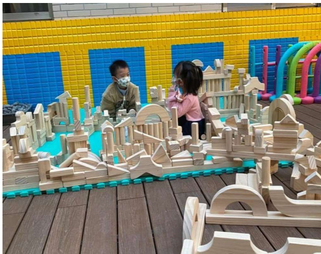
幾何積木建構:邏輯幾何概念~~拜登鐵塔